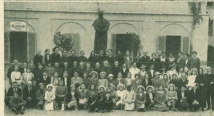
...da Laveno Mombello - da Casale Monf. - da Pinerolo - da Caniglie d'Asti.