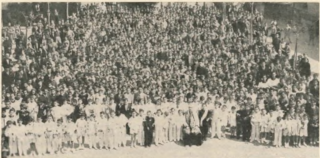
Oratori fiorenti. - Palermo: 1300 oratoriani presenti alla festa delle Prime Comunioni.