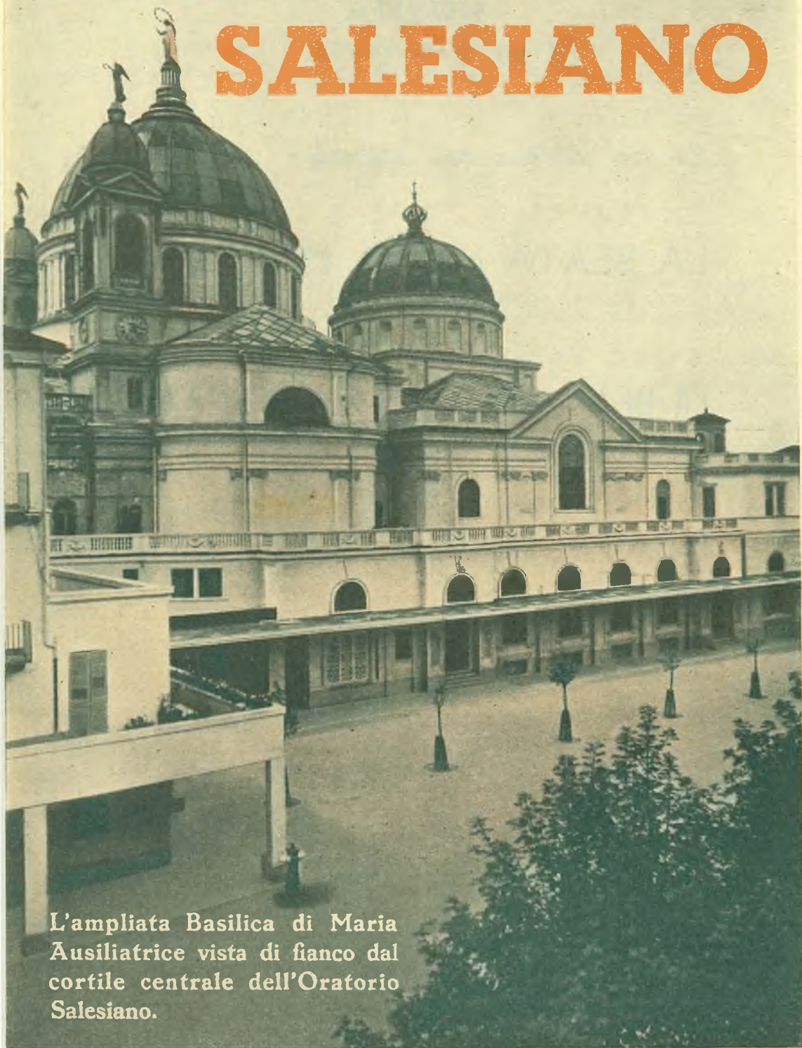
L'ampliata Basilica di Maria Ausiliatrice vista di fianco dal cortile centrale dell'Oratorio Salesiano.