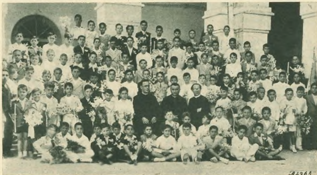
Oratori fiorenti. - Prime Comunioni al nostro Oratorio di Bari.