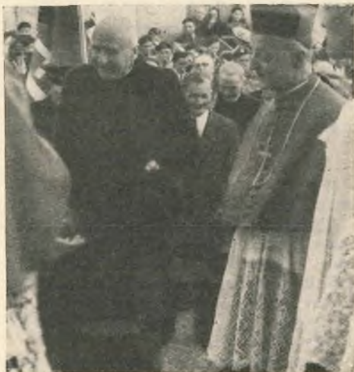
Mirabello Monterrato. - Il Rettor Maggiore con Mons. Vescovo accolto alla porta della chiesa parrocchiale.