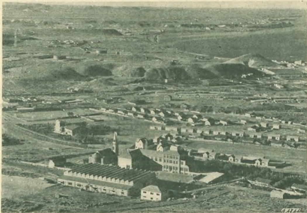
Comodoro Rivadavia. - Veduta generale della zona petrolifera: in primo piano l'Istituto Salesiano e la parrocchia.