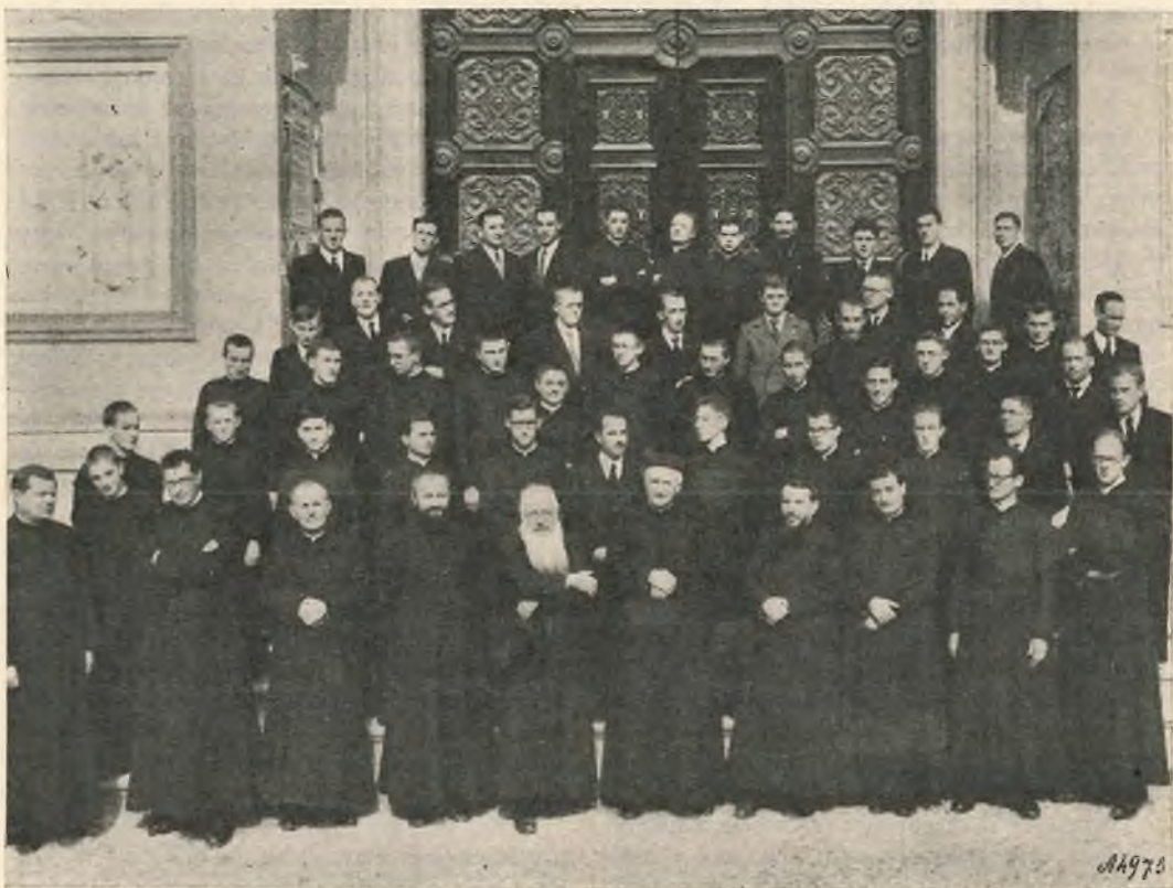
Torino. - L'ultimo gruppo dei missionari salesiani, presenti alla funzione d'addio, nella Basilica di Maria Ausiliatrice, il 9 ottobre u. s.