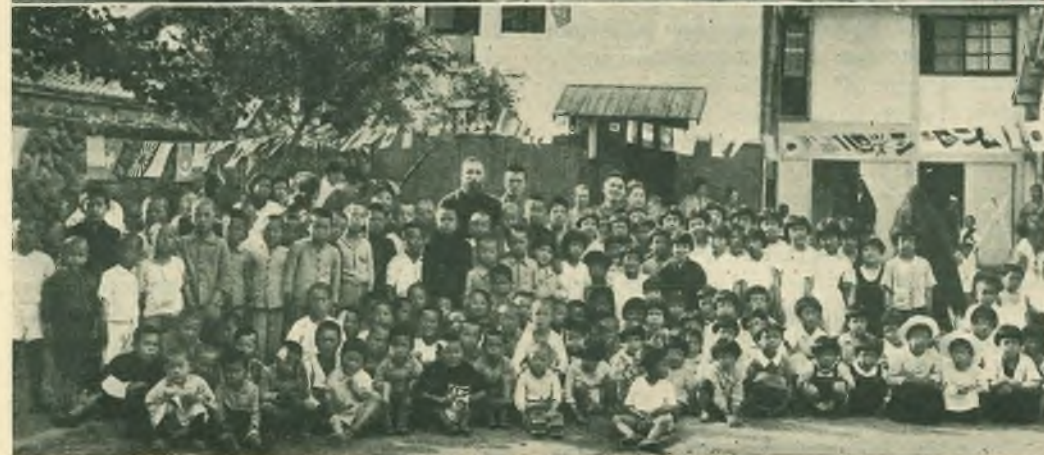
Beppu. - La festa di Maria Ausiliatrice al nostro "Saiuri Aigién".