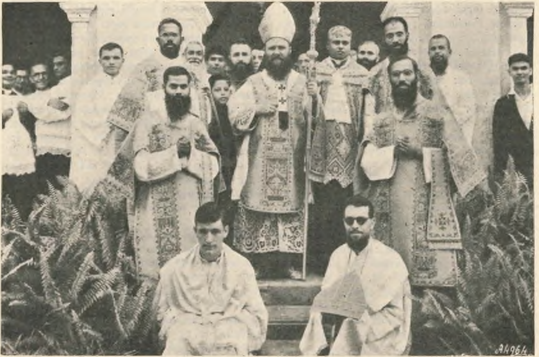
Madras. - S. E. l'Arcivescovo Mons. Mathias, dopo la Messa giubilare.

solo coi miei giovani kivari, in un piccolo rifugio, esposto al freddo e alla umidità di quelle giornate piovose, era cosa da perdermi d'animo. Tuttavia, rassegnato a coronare l'escursione anche col sacrificio della vita, confidando nella nostra Ausiliatrice, il mattino seguente, nonostante l'alta febbre, mi rimisi in cammino, su per un'erta montagna di nuovo sotto la