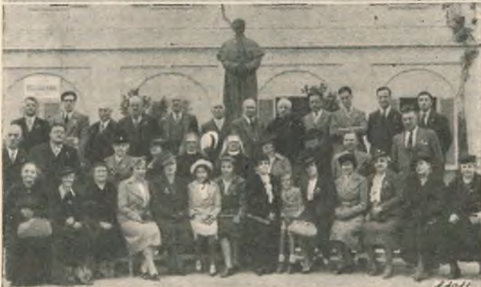
Pellegrini all' Ausiliatrice: Seminaristi di Fossano con Mons. Vescovo - Devoti da Recetto Novarese - da Genova Sampierdarena - da Maroggia (Svizzera)...

la febbre sparisse del tutto e il 17 settembre per la prima volta mi alzai.