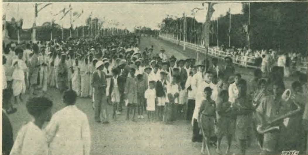
Madras. Il Congresso Eucaristico Nazionale. Il parco coll'altare monumentale. Vescovi e Prelati intervenuti - Lo sfilamento della processione.