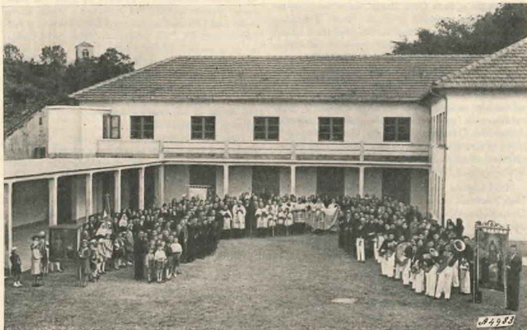
Montalenghe. - Il nuovo Oratorio salesiano benedetto dal Rettor Maggiore.