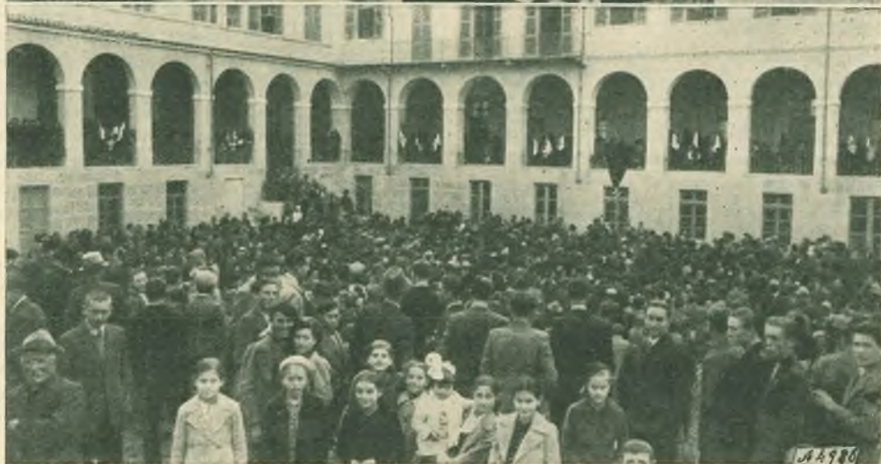
Mirabello Monferrato. - Il gaio aspetto dell'Istituto - Le Autorità convenute alla inaugurazione - La folla.